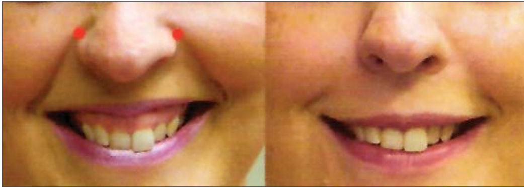
Antes y después del tratamiento de corrección de la sonrisa gingival. Se muestran los puntos de inyección

El tratamiento de las líneas cigomáticas profundas tiene más probabilidades de tener éxito en personas jóvenes que en las de más edad y si las líneas profundas sólo aparecen al sonreír. Las líneas profundas presentes en reposo cuando el paciente no está sonriendo sólo pueden reducirse mediante cirugía de estiramiento facial.