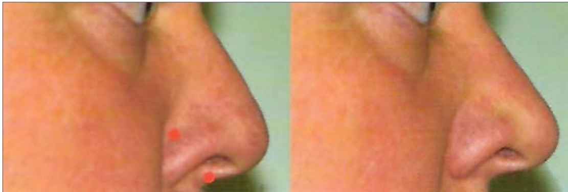
Antes y después de un tratamiento de levantamiento de la punta de la nariz. Se muestran los puntos de inyección

Las comisuras caídas de la boca pueden levantarse mediante inyecciones de entre 4 y 6 unidades aplicadas en el músculo depresor del ángulo de la boca a cada lado de ésta. Los puntos de inyección óptimos pueden encontrarse continuando hacia abajo la trayectoria de la línea nasolabial e inyectando aproximadamente 1 cm. por encima del borde de la mandíbula.