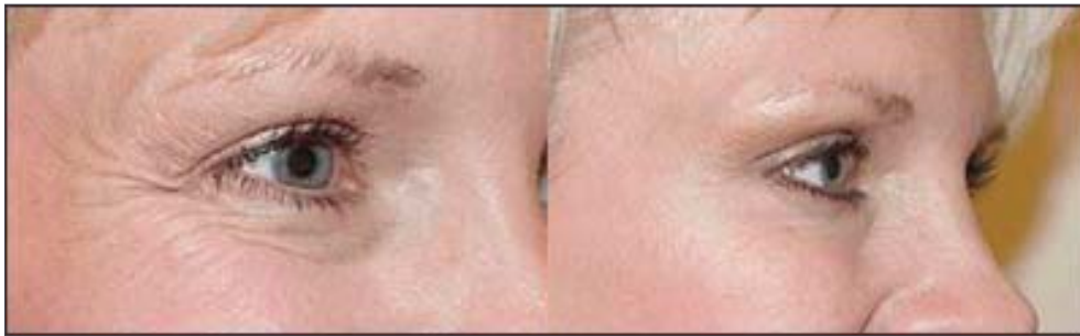
Antes y después del tratamiento de patas de gallo.