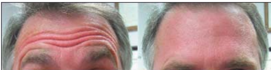
Antes y después del tratamiento de arrugas de la frente.