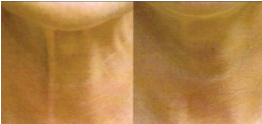
Antes y después del tratamiento de bandas platismales.

En los pacientes ancianos, la pérdida de elasticidad reduce el efecto de los músculos platisma laterales. La dosis total dependerá de cuántas bandas platismales se quiera tratar, pero debe utilizarse un máximo de entre 20 y 40 unidades para alisar cuatro bandas platismales.